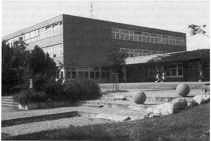
Das Hauptschulgebäude mit dem schon teilweise umgestalteten Pausenhof. Vor 4 Jahren kam im vorderen Teil noch ein Wasserspiel hinzu.

Dieser Neubau diente nun als Hauptschule, der Altbau als Grundschule. Die Erfahrungen der letzten 10 Jahre und das immer noch stark anhaltende Wachstum der Gemeinde hatten den Gemeinderat dazu bewogen, die bereits genehmigten Baupläne für ein einstöckiges Gebäude umzustößeln und ein zweites Stockwerk zu beantragen. So sieht die Hauptschule heute folgendermaßen aus: Im Erdgeschoss liegt zur Grundschule hin der Verwaltungstrakt mit dem Lehrerzimmer (das alte samt Rektorat wurde zum Handarbeitsraum umgebaut), ein in zwei Räume trennbarer Musik- und Festsaal, ein Werk- mit Materialraum, im Osten zur Pausenhalle die Schülertoiletten und ein Freizeitraum, der z. Zt. hauptsächlich für die Kernzeitenbetreuung genutzt wird. Das großzügige zentrale Treppenhaus erschließt die beiden oberen Stockwerke mit je 5 Klassenzimmern, 2 Kursräumen, Physiksaal, Fotolabor, Kunst- und Computerraum. Ein überdachter Gang verbindet Grund- und Hauptschule.