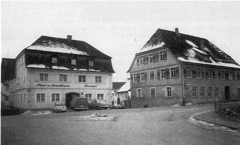
Das 2. Schulhaus, das ehemalige Ottobeurer Amtshaus, wurde 1970 abgebrochen, nachdem es noch einem Textilhandel als Verkaufsstelle diente. Heute steht hier die Volksbank. Das linke Gebäude nahm die Schule während des Umbaus 1851 auf.

Schulhaus wurde nun nicht mehr gebraucht und als - erstes! - Spritzenhaus verwendet; auch der Schuppen an der Schule fand eine neue Nutzung: hier stand der Leichenwagen. Staiger beschreibt es uns 1861 so: „Dieses Gebäude steht gleich am Eingang des Fleckens, von Meersburg her, dem Pfarrhause gegenüber.... Es besteht nun aus zwei Stockwerken, hat zwei helle und geräumige Schulzimmer und die Lehrerwohnung mit 5 Zimmern und Kammern (3 unten, 2 oben)“. Der Lehrer „hat noch den Schulgarten zu benützen. Dem Unterlehrer... ist eine Wohnung mit einem Zimmer im Schulhause eingeräumt.“ 115 Kinder hatte die Schule damals.